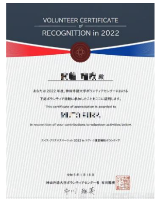
▲ ボランティア参加証(例)

また、会の最後には2022年に実施されたボランティア活動の様子が垣間見られるスライドショーが上映され、本学学生がどのようなボランティア活動に参加し、どのような体験をしたのか、今後ボランティアに挑戦する学生へのヒントになりました。